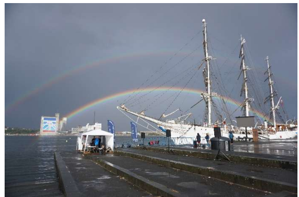
Regatta in Aalborg