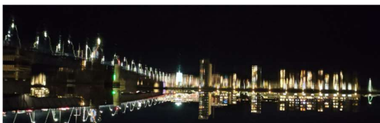
Aalborg bei Nacht