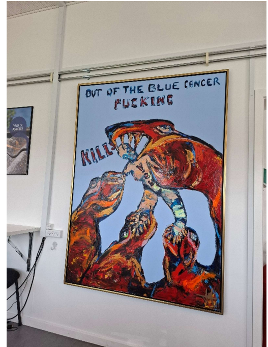
Wanddekoration in der Laborkantine

Unsere Erlebnisse hier können wir jeden nur herzlichst empfehlen, ein Auslandspraktikum ist eine unglaubliche Erfahrung, die jeder, wenn möglich ergreifen sollte!